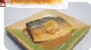
温めるだけの「さばの味噌煮」