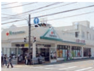
●マルエツ 平二丁目店 (神奈川県川崎市 4月26日)