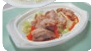
レンジアップ商品「鶏もも野菜煮し(塩麹)」