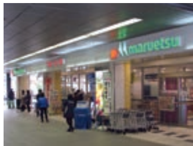
●マルエツ 東松戸駅店 (千葉県松戸市 11月22日)