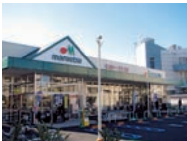
●マルエツ 赤羽台店 (東京都北区 12月1日)