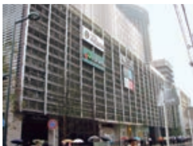
●マルエツ 武蔵小杉駅前店 (神奈川県川崎市 4月2日)