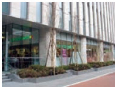
●マルエツ プチ 日本橋本町店 (東京都中央区 2月14日)