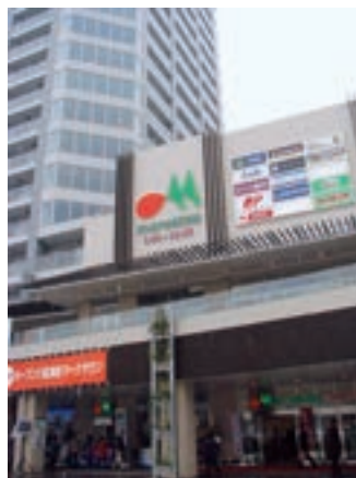
●マルエツ 長津田駅前店 (神奈川県横浜市 3月27日)