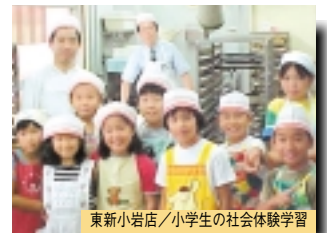
東新小岩店 / 小学生の社会体験学習