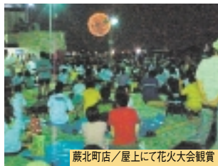
蕨北町店 / 屋上にて花火大会観賞

店長への直行便 地域のお客様の大切な「声」に、スピーディーかつ正確に対応し、地域に密着した「地縁ストア」づくりを推進しております。