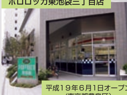
ポロロッカ東池袋三丁目店