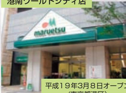
港南ワールドシティ店