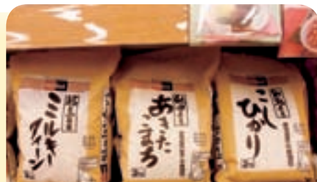
変わらぬ人気のFOODeXのお米と HOMEeX「無漂白キッチンタオル」