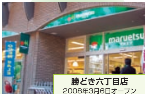
勝どき六丁目店 2008年3月6日オープン (東京都中央区)