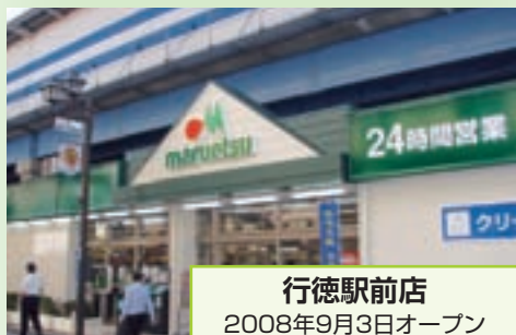
行徳駅前店 2008年9月3日オープン (千葉県市川市)