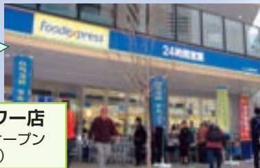
港南シティタワー店 2008年6月6日オープン (東京都港区)