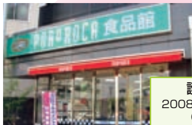
護国寺駅前店 2008年4月24日オープン (東京都文京区)