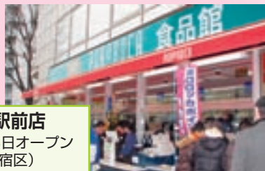
西早稲田駅前店 2009年2月28日オープン (東京都新宿区)