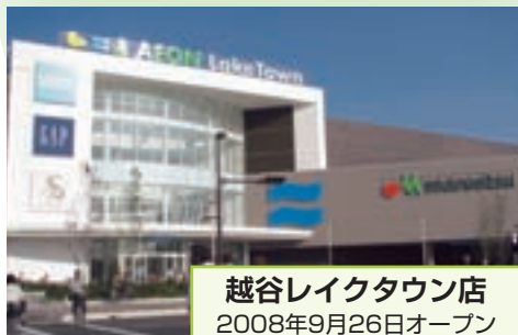
越谷レイクタウン店 2008年9月26日オープン (埼玉県越谷市)