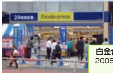
白金台プラチナ通り店 2008年5月30日オープン (東京都港区)