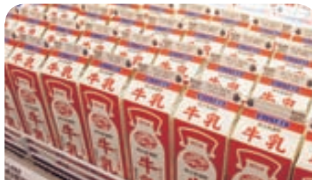
売れ行きが好調な 「おいしさ直送牛乳」と「おいしいとうふ」