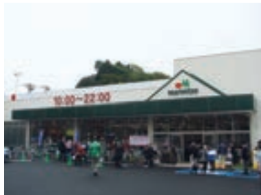
●マルエツ 戸塚舞岡店 (神奈川県横浜市 4月26日)