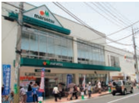
●マルエツ 中山店 (神奈川県横浜市 6月27日)

当社では、LED照明を基本照明等に使用するなど、環境負荷抑制に取り組んでいます。今年6月にリプレイスオープンした「マルエツ中山店」では、これらの取り組みに加え、天窓からの自然採光や屋上緑化など、環境に配慮した店づくりを行っています。