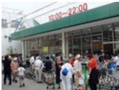
●マルエツ 京町店 (神奈川県川崎市 7月24日)