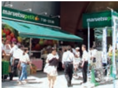
●マルエツ プチ 本郷二丁目店 (東京都文京区 7月11日)