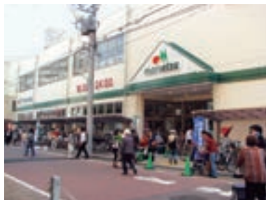
●マルエツ 新田店 (東京都大田区 10月23日)