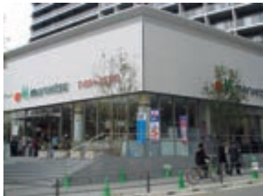
●マルエツ 新宿六丁目店 (東京都新宿区 3月8日)