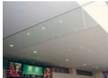
LEDで電気使用量を削減