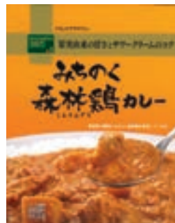
「みちのく森林鶏カレー」 210g 298円(税込)