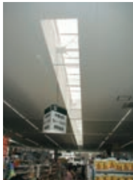
天窓からの自然の光で 店内を明るくします