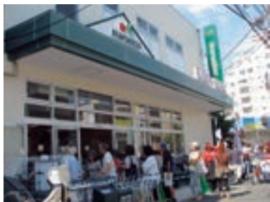
●マルエツ 新江古田駅前店 (東京都中野区 9月5日)