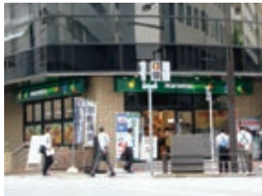
●マルエツ プチ 新川一丁目店 (東京都中央区 7月20日)