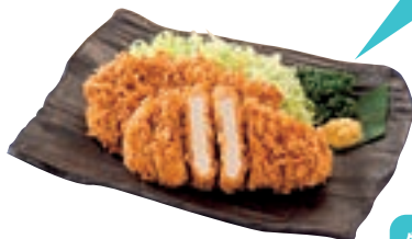
「手作りロースカツ」