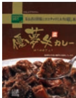
「優夢牛カレー」 210g 398円(税込)