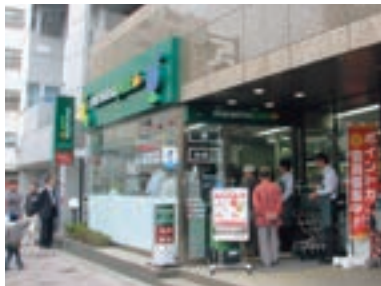
●マルエツ プチ 池之端二丁目店 (東京都台東区 5月9日)