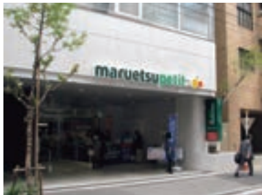
●マルエツ プチ 一番町店 (東京都千代田区 4月20日)