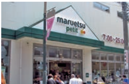
●マルエツ プチ 駒込中里一丁目店 (東京都北区 5月15日)