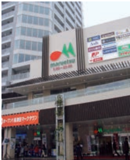
●マルエツ 長津田駅前店 (神奈川県横浜市 3月27日)