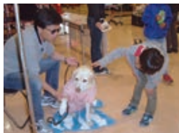
四季の森フォレオ店(神奈川県横浜市)での「盲導犬ふれあいキャンペーン」。

1993年より実施している「盲導犬育成募金」の他、目の不自由な方々への理解を深める活動として、盲導犬訓練センターの見学会や、盲導犬をより身近に感じていただく「盲導犬ふれあいキャンペーン」を、店舗で実施しています。