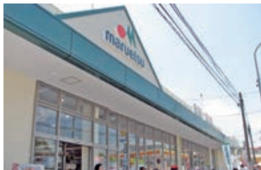
●マルエツ 戸塚大坂下店 (神奈川県横浜市 5月31日)