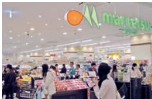
●マルエツ 武蔵小杉駅前店 (神奈川県川崎市 4月2日)