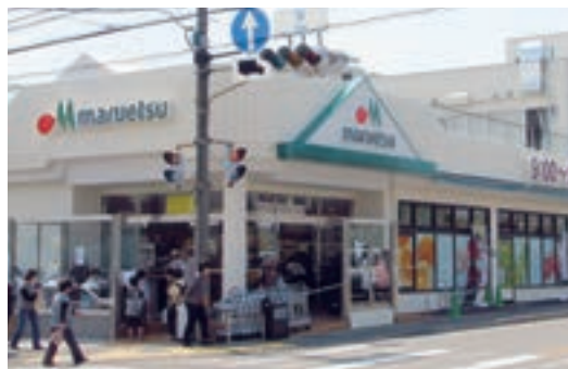
●マルエツ 平二丁目店 (神奈川県川崎市 4月26日)