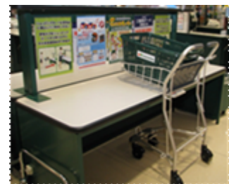
サッカー台イメージ