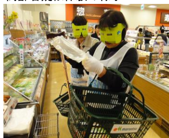
高齢者疑似体験の様子