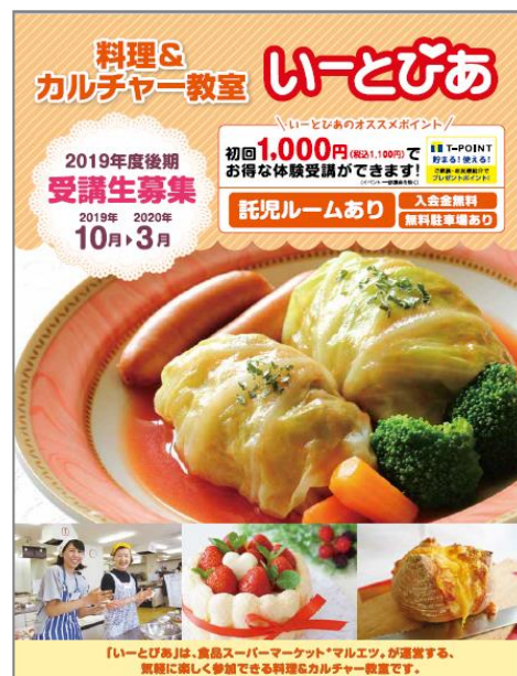
※2019年度後期講座パンフレットイメージ