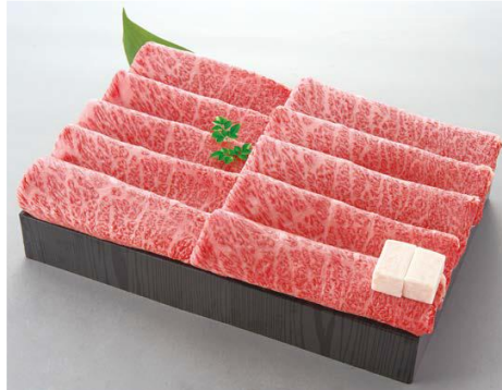
「松阪牛 肩ロースうすぎり」 肩ロース肉うすぎり 600g 本体 14,500 円 (8%税込 15,660 円) ⇒マル得 10%引 本体価格 13,050 円 (8%税込 14,094 円) 冷凍