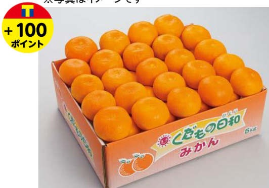
「長崎県産 くだもの日和みかん」 L サイズ約 5kg 本体 4,800 円 (8%税込 5,184 円) ⇒マル得 10%引 本体価格 4,320 円 (8%税込 4,665 円)