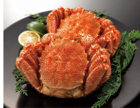
「北海道産ボイル毛がに 2 尾」 (北海道産)約 430g×2 尾 本体 10,800 円 (8%税込 11,664 円) ⇒マル得 10%引 本体価格 9,720 円 (8%税込 10,497 円) 冷凍 数量限定 200 セット