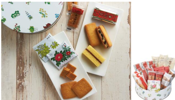
「六花亭 六花セレクト缶(花柄)」25 個入 マルセイバターサンド×8 個、マルセイキャラメル・マルセイ ビスケット×各 5 個、霜だたみ・いつか来た道・北加伊道×各 2 個、 ストロベリーチョコホワイト 60g×1 袋 本体 3,750 円 (8%税込 4,050 円)