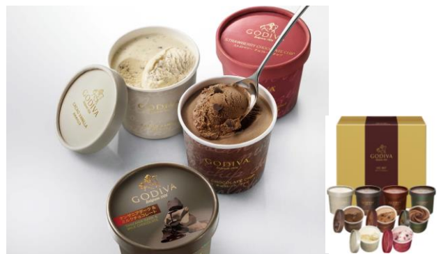
「ゴディバ アイスギフトセット 9 個入」 カップアイス 125ml(ベルジアンダークチョコレート、ミルク チョコレートチップ、タンザニアダーク&ミルクチョコレート、 カカオバナナ)×各 2、ストロベリーチョコレートチップ×1 本体 5,000 円 (8%税込 5,400 円) 冷凍 数量限定 400 セット