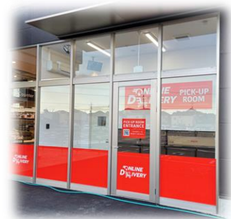
※掲載の写真は全てイメージです