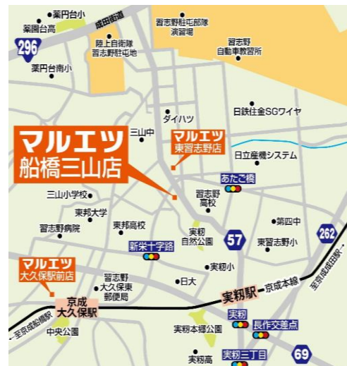
京成電鉄京成本線「実叡駅」北口から徒歩約15分

年齢別人口構成比:船橋市と比較して、15歳~24歳が11.3%と1.6%、55歳以上が36.5%と2.8%高く、25歳~44歳は25.2%と3.7%低い地域となっています。