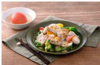
※ミールキットの調理例

いつでもどこからでも、欲しい商品をスマートフォンやパソコンからご注文いただけるネットスーパーです。店舗で取り扱う商品はもちろん、シェフ監修本格メニューのミールキットや家電製品、銘産品など、店舗で取り扱いの無い商品も含め約1万種類品揃えいたします。受取方法としては、ご自宅への配送だけでなくお車に乗ったまま商品をお受け取りいただけるドライブスルーや、店舗へ入店することなく商品をお受け取りいただける無人ピックアップルームサービスを導入いたします。