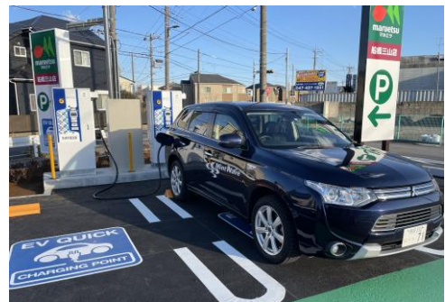
※掲載の写真は全てイメージです

環境に配慮した対応として、店舗の屋上に太陽光発電設備を設置し、その電力を店舗の営業活動に使用するほか、地域のお客さまにもお役に立ていただけるような取り組みを今後、進めてまいります。また、お買物中にご利用いただけるよう、お客さま用の駐車場に電気自動車用の急速充電スタンド(有料)を設置いたします。