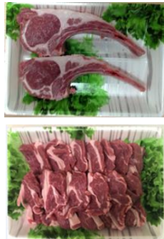
サフォーククロスラム