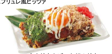
店内焼き上げ！お好み焼き