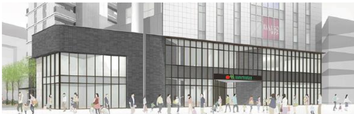
※図はイメージです

<マルエツ 一之江駅前店 ストアコンセプト> 笑顔と活気にあふれ、地域のお客さまに【マイストア】として必要なお店を目指します