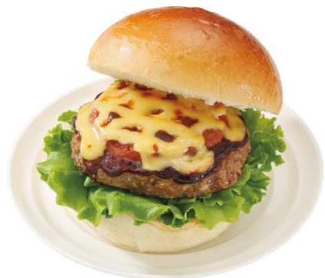
大豆ミートのハンバーグとトマトチーズバーガー