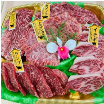
焼肉食べ比べセット

イチボやトモサンカク等の希少部位を使用した「焼肉食べ比べセット」をインスタ加工で販売いたします。また、サフォーククロスラム肉等、こだわりの商品を品揃えいたします。