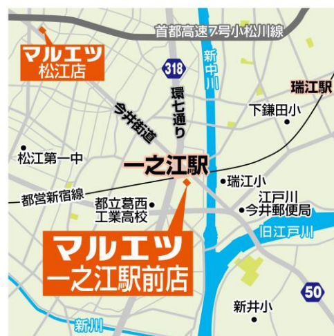
都営地下鉄新宿線「一之江駅」A3c出入口前

年齢別人口構成比:江戸川区と比較して、25歳～54歳が46.9%と1.9%高い地域となっています。