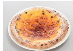
クレームブリュレ風ピッツァ

また、鉄板焼きメニューとして、店内で一つ一つ丁寧に焼き上げた「お好み焼き」「玉子焼き」を販売いたします。