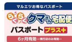
※定額制パスポートイメージ