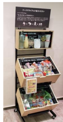
当社オリジナルの 食品寄付ボックス