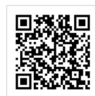
Tサイト(Tポイント募金) マルエツ×むすびえ 「子ども食堂」応援募金