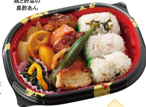
ほうれん草 のごま和え

5色(赤・黒・黄・緑・白)の食材を入れた彩り鮮やかなお弁当。主食は、もち麦を使用した「おにぎり」にすることで手軽に手に取りやすくしました。また、鶏肉と根菜類(にんじん、れんこん、さつまいも)を黒酢あんできてることで、食べやすく仕上げました。