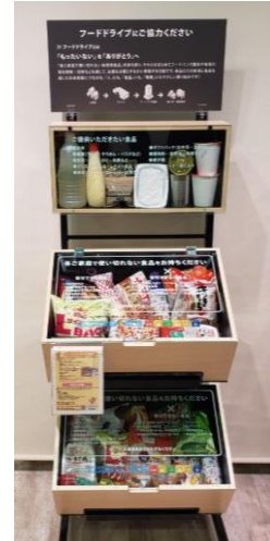
当社オリジナルの食品寄付ボックス

■お問い合わせ先 経営管理部(広報) 田中・都築・古澤 (電話 03-3590-0016)