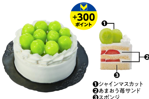
シャインマスカットケーキ (オリジナル)

福岡県産のあまおう苺を使用した、こだわりのクリスマスケーキです。ケーキの内側にも、あまおう苺をサンドしています。