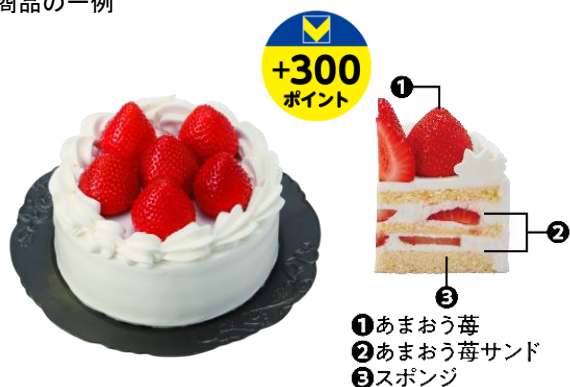
あまおう苺のケーキ (オリジナル)