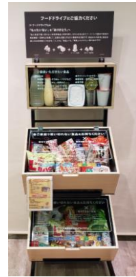
当社オリジナルの食品寄付ボックス