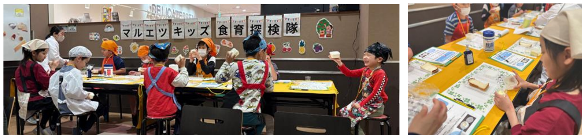
「キッズ食育探検隊ツアー&バター作り体験イベント」の様子(蕨北町店)

マルエツのイベントでは、「食を選ぶ力」を身につけることや、季節催事に合わせた食文化の継承など、幅広い視点から“食を通じて地域とつながり、心身ともに健康であること”を目指します。