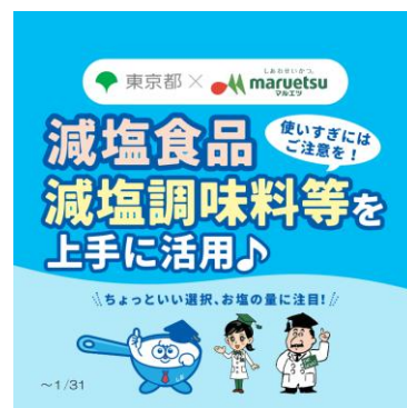
掲載物のイメージ

当社では、オリジナルキャラクター「Dr.元気」と「栄子」が案内役となり、健康的な食生活を、楽しく分かりやすく提案する売場展開を行っております。今回の取り組みにおいても、両キャラクターが登場し、お客さまに塩分を控えた食生活の大切さを親しみやすく伝えています。