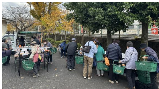
移動スーパーでのお買物の様子

本イベントでは、マルエツの食育推進「いーとぴあ」が野菜摂取量や血管年齢の測定などを通じて、楽しみながらご自身の健康状態を知る機会をご提供いたします。また、管理栄養士による栄養相談会の実施や、川崎市と連携し健康づくりに役立つ情報の発信も行います。マルエツの移動スーパーが、お買物を楽しみながらご自身の健康や食生活を見直すきっかけづくり、またコミュニケーションの場となることを目指します。